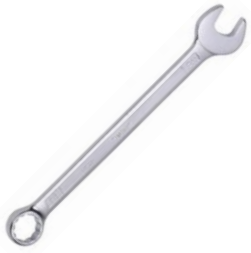
der Gabelring- schlüssel