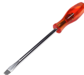
der Schrauben- zieher