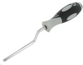
der Speichennippel- dreher