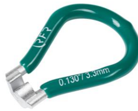
der Speichen- schlüssel